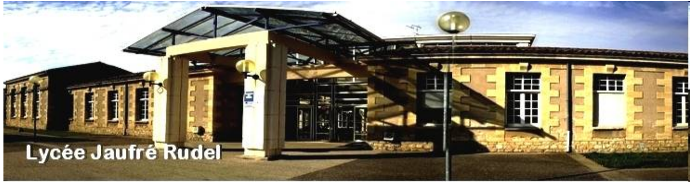
Lycée Jauffré Rudel